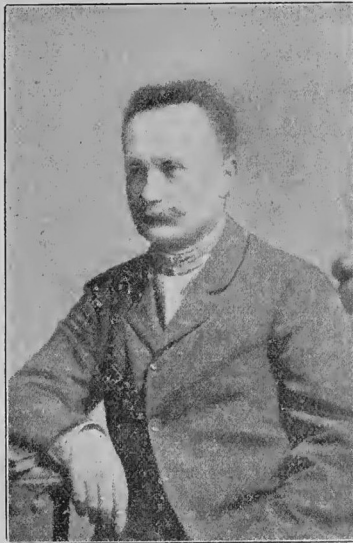
Іван Франко (1856—1916).

Нині можемо сказати, що куди б ти не повернувся в нашу минавшину за останніх 40 літ, всюди стрінешся з іменем Д-ра Івана Франка, всюди він приложив свою добру руку, всюди оставив тріпки сліди в науці нашої, у письменстві, в журналістиці, в суспільно-економічній праці, в політиці, в парламентаризмі, в театрі, одним словом всюди. Село, город, рілля,