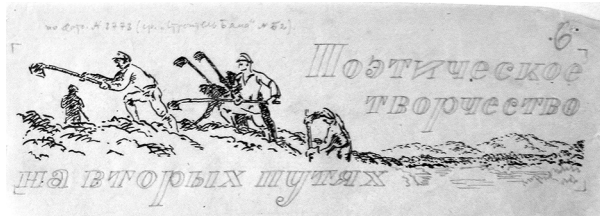
Рис. 4. Заставки Д. Гордєєва до збірок віршів табірних поетів. (ЦДАМЛМУ. Ф. 208. Оп. 2. Спр. 19. Арк. 6.)

Щоправда, інколи тематика художніх робіт (оформлення статей) була і більш приємною. Як-от, у номері за 10 лютого 1937 р. було розміщено заставки Д. Гордєєва та стаття до ювілею О. Пушкіна 13 . Він же оформлював заставки до збірок віршів табірників «Книжкова полиця», «Пісня якутських бійців» і «Вірші табірників» 14 (рис. 4).