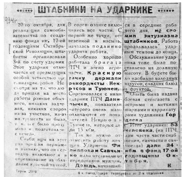
Рис. 2. Газета-бюлетень «Строитель БАМа». (ЦДАМЛМУ. Ф. 208. Оп. 2. Спр. 243. Арк. 23 зв.)

роботи на «ударнику» для ліквідації «прориву» перед святом більшовицької революції відобразились у газеті-бюлетені «Строитель БАМа» (рис. 2).