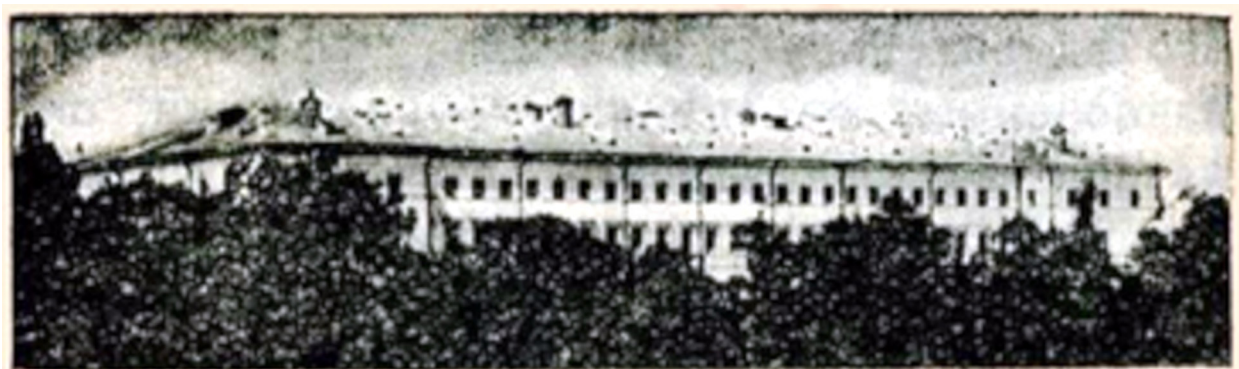
Рис. 3. Інститут шляхетних дівчат з боку вул. Олександрівської (Карманный... 1906. С. 19.)