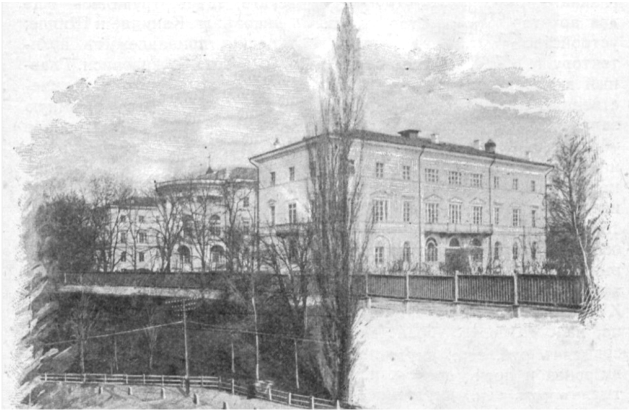
Рис. 2. Інститут шляхетних дівчат з боку вул. Інститутської (Свирский К. Практический... 1901. С. 152; Сементовский Н. Киев, его... 1900. С. 148; Ciechowsky W. Kijów... S. 286.)