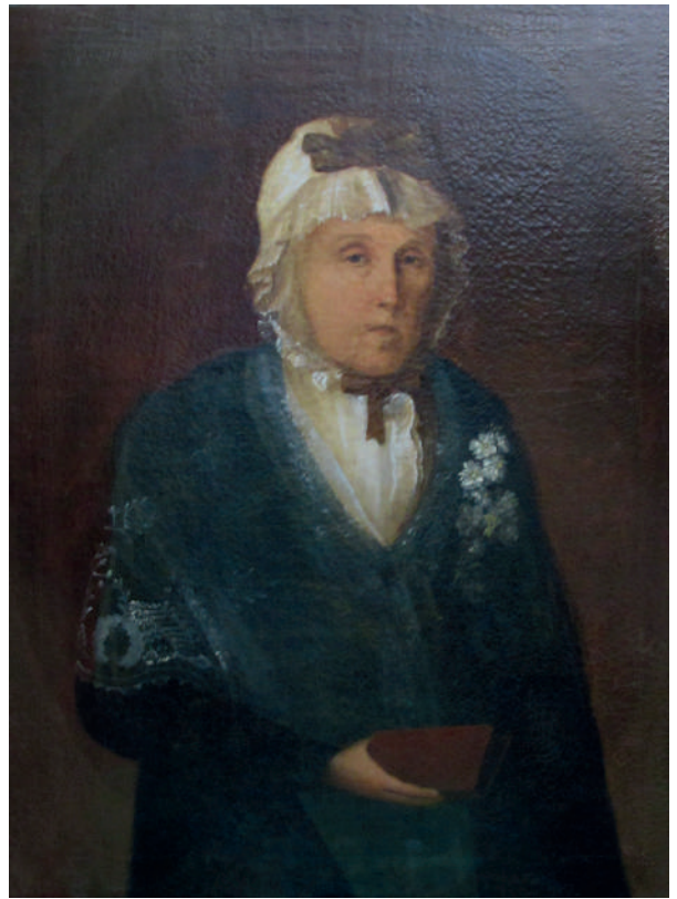
Рис. 10. Невідомий художник. Портрет Катерини Юхимівни Галаган. Кін. XVIII ст. Полотно, олія

Автор, «імовірно дворовий кріпак, який мав досвід копіювання професійних портретів» (Там само), зобразив цю жінку, яка, за словами правника, була «сповнена енергії та надзвичайно своєрідна» (Галаган Г.П., 1896. С. 11), близьку родичку Розумовських й одну з найбагатших поміщиць Лівобережної України, так, що жодна деталь портрета не засвідчує ані її соціальний статус, ані її статки. Вочевидь, це наслідок об'єктивного відтворення побаченого, принаймні Г. Галаган писав про граничне благочестя своєї прабабусі та її вірність «старим звичаям»: «вона дотримувалася постів, одягалася просто й у домашньому побуті говорила малоросійською...» (Там само. С. 12). У цьому камерному портреті стриманої колірної гамою, визначеної вдалим співвідношенням брунатного тла, ультрамаринових тонів шалі та сукні, контрастних світлих плям чепця і сорочки, оживлених червоно-коричневими відтінками молитовника й стрічок на головному уборі, безумовно, відчутна естетика сентименталізму з її увагою до деталей та інтимізацією образу людини (рис. 10).