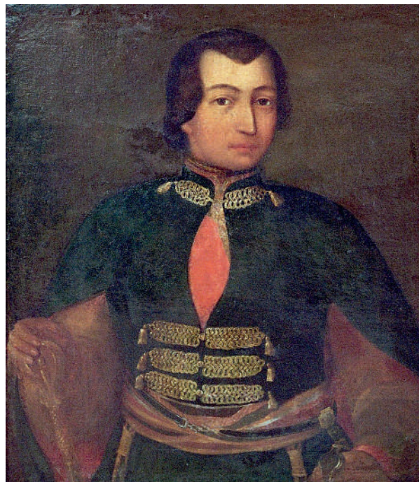
Рис. 4. Невідомий художник.

в країнах Північної та Центральної Європи на межі XVII–XVIII ст. Вони ж використовувалися як «жалуване плаття», приміром, кілька «каптанів угорських було «пожалувано» гетьману Івану Мазепі Петром I з 1700 до 1703 р. 26 До 1740-х рр. «угорське плаття» в імперській армії було замінено на «німецьке» та «французьке», але, як бачимо, однострій на базі доломану залишився в ужитку козацької старшини, до того ж його було використано (уже у варіанті мундирів гусарського зразка) через кілька десятків років для форми компанійців надвірної хоругви гетьмана Кирила Розумовського (Сокирко О., 2019. С. 62).