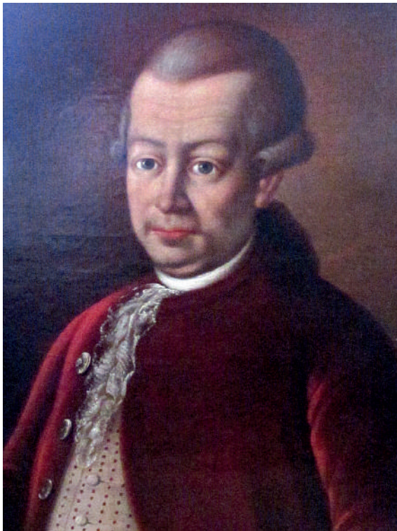
Рис. 6. Землюков Степан. Копія портрета Івана Григоровича Галагана. 1840-ві рр. Полотно, олія

В обох портретах — і оригінальному, і копії — батько й син Галагани постають особами з кола європейської аристократії: у жустокорах, інтенсивний колір яких відтінено світлими жабо, у коротких, ледь припудрених перуках. Одяг портретованих уповні відповідає модним тенденціям останньої чверті XVIII ст., коли граційна химерність рокайлю у чоловічих строях поступово сходила нанівець, хоча її відлуння залишалося у виборі тканин, їхній фактурі, кольоровій гамі, у декоруванні. Обидва полотна належать до типу камерних, вони позбавлені надмірної пишності, але м'які блискучі тканини одягу моделей у поєднанні з матовим мереживом створюють ефект грайливої ошатності. І якщо художнє враження від портрета Івана Галагана зумовлене основною кольоровою плямою — насичено-вишневим жюстокором, то естетичний вплив портрета Григорія Галагана визначає ефектне поєднання золотаво-сріблястої тасьми окантовки з інтенсивним чорним тоном строїв. Обидві роботи,