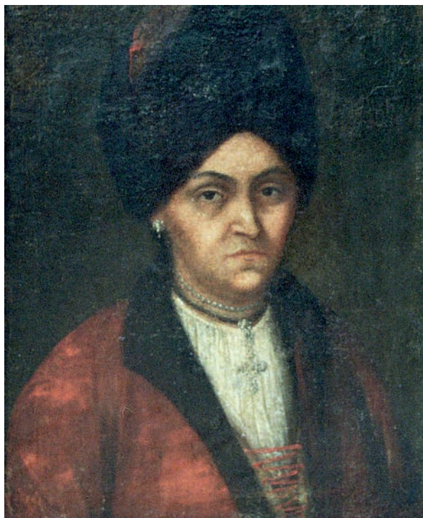
Рис. 2. Невідомий художник. Портрет Олени Антонівни Ґалаґан. 1740-ві рр. Полотно, олія

У цих портретах подружжя Ґалаґанів зовнішні прикмети високого соціального положення моделей не акцентовано, але традиційні строї козацької старшини вказують на статусність, хоча портрети позбавлені квітчастої орнаментики, наявної у творах з інших родинних зібрань. Якщо до середини XVIII ст. такий одяг слугував засобом легітимації автономії Гетьманщини