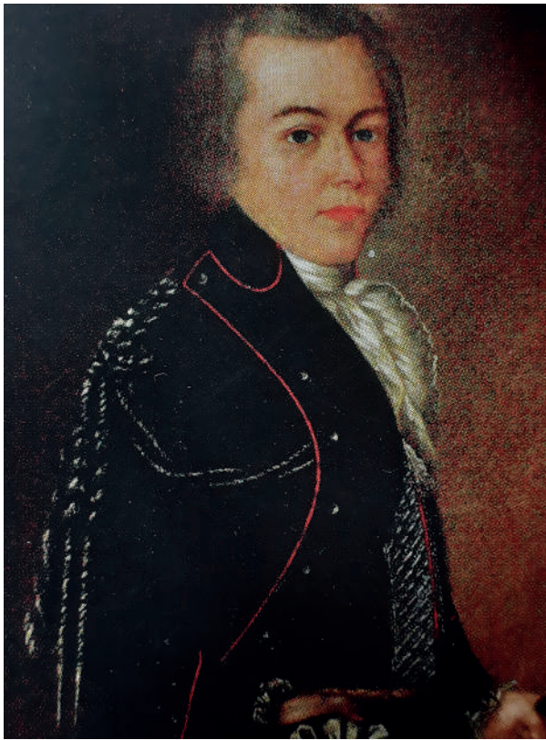
Рис. 9. Землюков Федір. Портрет Григорія Івановича Галагана. 1796 р.